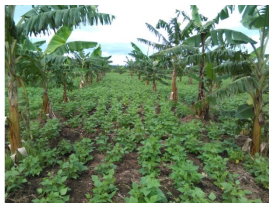
Succes met een nieuw ras bananen. Dit ras is minder ziektegevoelig.