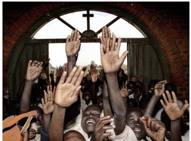
Kerstviering in Congo

Stichting de Zaaier wil alle donateurs, groot of klein hartelijk bedanken voor haar ondersteuning. Dankzij uw giften kunnen wij het werk in Congo blijven voortzetten! Wij wensen een ieder fijne feestdagen toe.